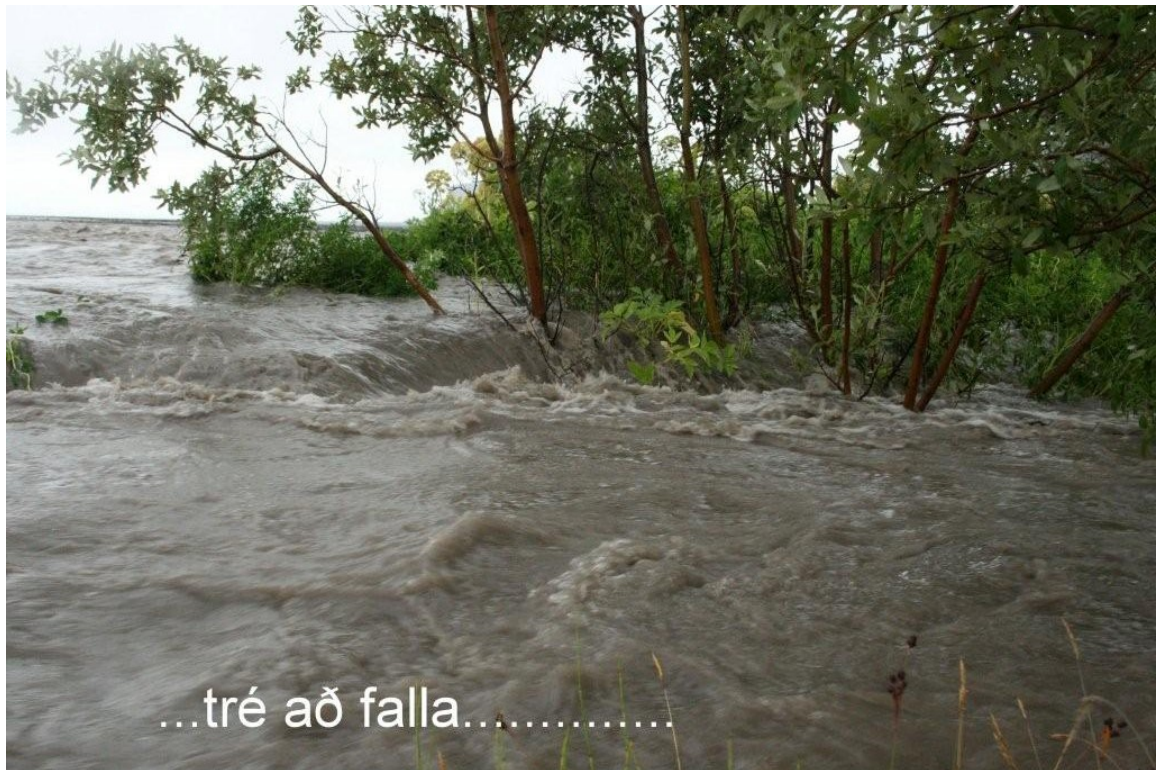
...tré að falla.....