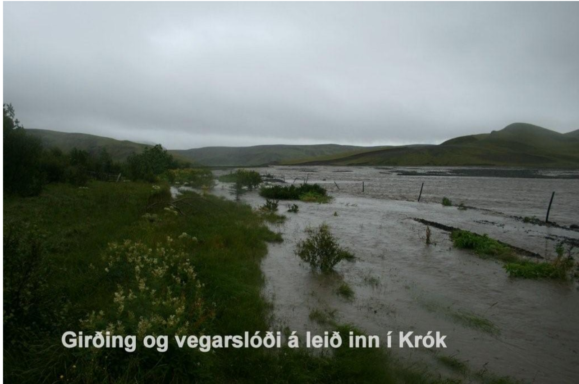
Girðing og vegarslóði á leið inn í Krók