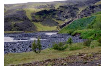
Hér var áður stuttur garður sem veitti ánni frá bakkanum.