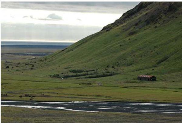
Dalbraut. Álftagrófavegur liggur meðfram fjallinu Felli og löndum 1-4. Hann sveigir síðan til austurs inn á Holtlandið og þar þarf að fara um til að komast að löndum 5-15.

Engin stofnskjöl hafa verið útbúin fyrir löndin.