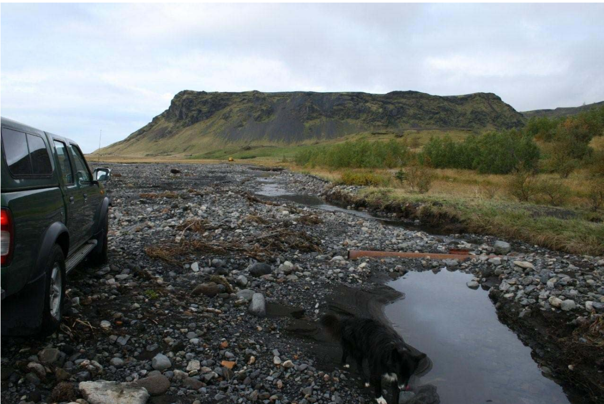
Séð til vesturs eftir vatnavexti.