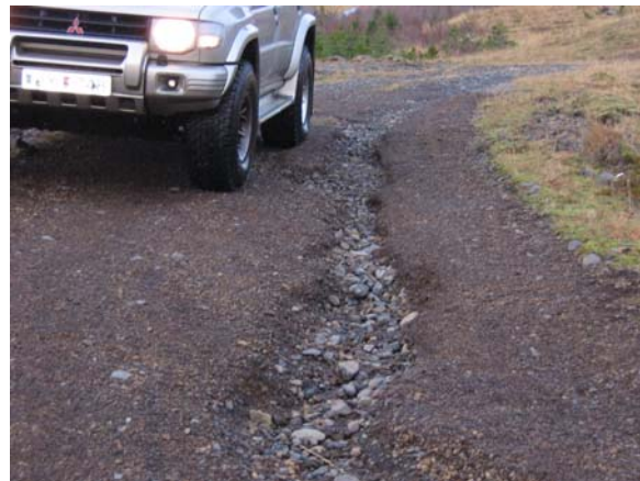
Í rigningum rennur vatn eftir öllum brautum á vestursvæðinu og skolar ofaníburði burt.