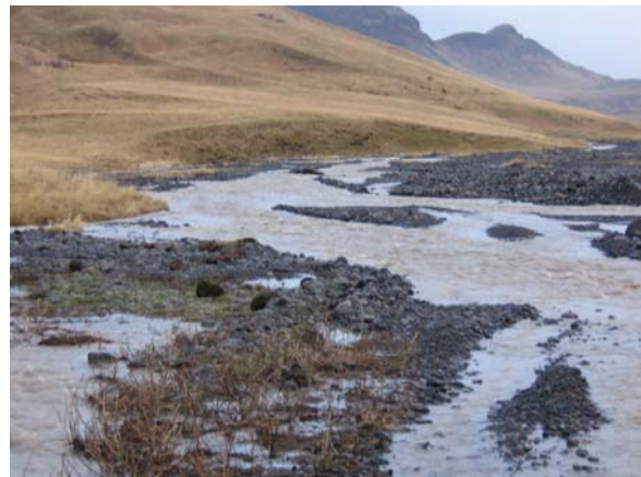
Nú rennur jökuláin Klifandi eftir vegarslóðanum eins og hún hefur oft gert áður.