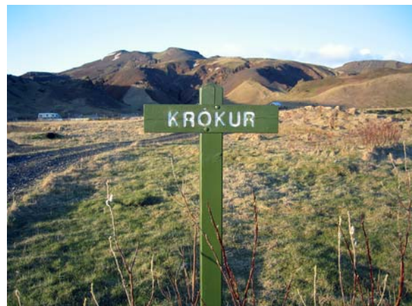
Krókur. Ofaniburð vantar í veginn.

Búið er að gera stofnskjöl fyrir 3 lönd af 7 sem eru í útleigu. Tveir landnemar eru með þinglýsta leigusamninga.