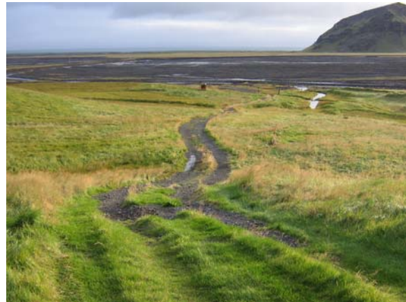
Séð niður Hólsbrautina frá landamerki landa 2 og 3. Hér endar vegurinn og liggur langt frá landi 1. Aðeins er fært jeppum að löndum 4-6.

Lagning vegar hefur aldrei verið kláruð. Vegurinn liggur að landamerkjum lóðar 2 og 3. Land 1 er ekki í vegasambandi, það liggur töluvert frá veginum og eina leiðin til að komast að því er að aka yfir land 2, sem aðeins er fært fjórhjóladrifnum bílum. Ljóst er að það gengur ekki til lengdar þar sem landnemi á landi 2 er að planta í spilduna. Byggja þarf vegarslóðann upp og setja stærra ræsi í veginn við landamerki lóðar 2 og 3. Þar liggur framræsluskurður þvert á vegarslóðann og þegar mikið vatn er í skurðinum flæðir það upp á vegarslóðann og rennur eftir honum niður alla brautina. Við það skolast allur ofaníburður í burtu og vegurinn verður illfær minni bílum. Þannig er ástandið núna.