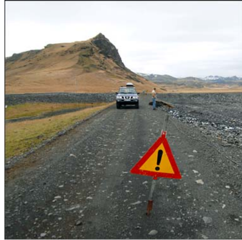
Vegaskemmdir í október 2009.

Það hefur verið árviss viðburður á þessu svæði að í miklum rigningum, sérstaklega á haustin, eiga sér stað mikil hlaup í jökulánum og flæmast þær um og eyðileggja vegi, girðingar og gróðurlendi. Mjög miklir vatnavextir voru í ágúst og september 2009 og urðu miklar skemmdir, sérstaklega þar sem varnargarðar voru í lélegu ástandi. Landnemar urðu innlykka á svæðinu og þurfti að aðstoða þá við að komast burt þegar sjatnaði í ánum. Komu fréttir um þetta í helstu fjölmiðlum. Hefur verið meira og minna ófært inn á svæðið síðan fyrir fólksbíla og óbreytta jeppa. Í þessari skýrslu og tilheyrandi fylgigögnum kemur fram hvernig ástandið á svæðinu er og í hvaða framkvæmdir þarf að ráðast á vormánuðum 2010. Er hér ekki eingöngu um að ræða framkvæmdir vegna skemmda eftir vatnavextina heldur einnig ýmis önnur brýn verkefni, sem sum hver hafa lengi verið þekkt.