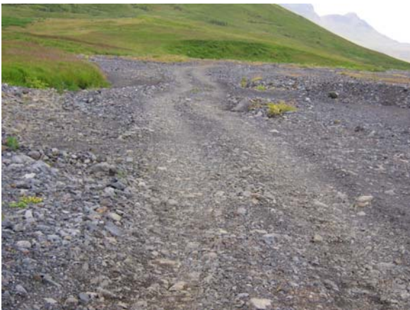
Vegarslóðinn austan við Einbúann, á mótis við Gilbraut.