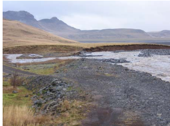
Séð frá Heiðarbraut. Hér var varnargarður beint yfir í Einbúann fyrir miðri mynd. Klifandi hefur brotið sér leið í gegnum garðinn og rennur eftir veginum til vinstri. Hinum megin við Einbúann vantar varnargarð og áin leitar sífellt inn á veginn. Sjá hér að neðan.