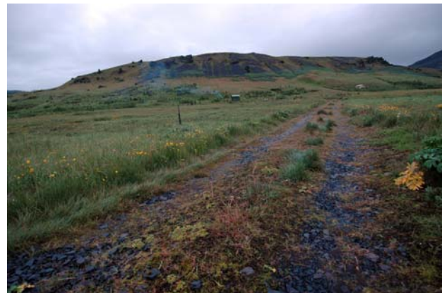
Hryggur í Hlíðarbrautinni og ofaniburður að hverfa.

Engin stofnskjöl hafa verið útbúin fyrir löndin. Einn landnemi er með þinglýstan leigusamning.