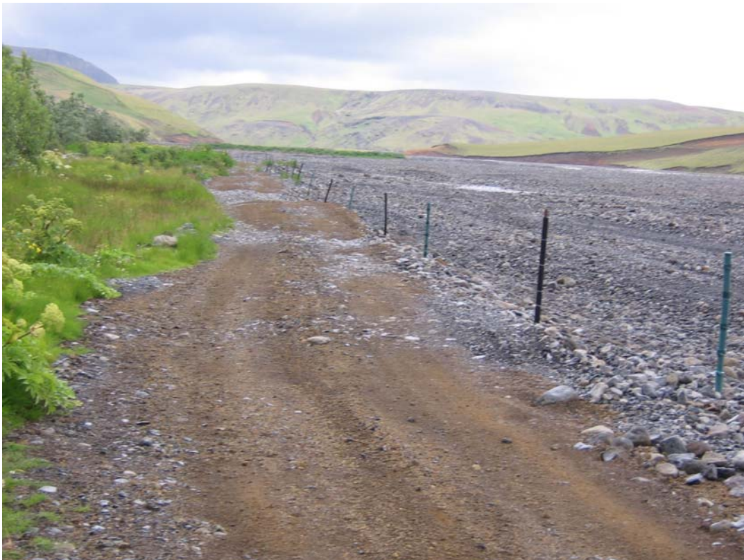
Séð til austurs. Vegarstæðið eins og það var. Sjá má hvernig ofaníbúður skolast úr veginum eftir rigningar.