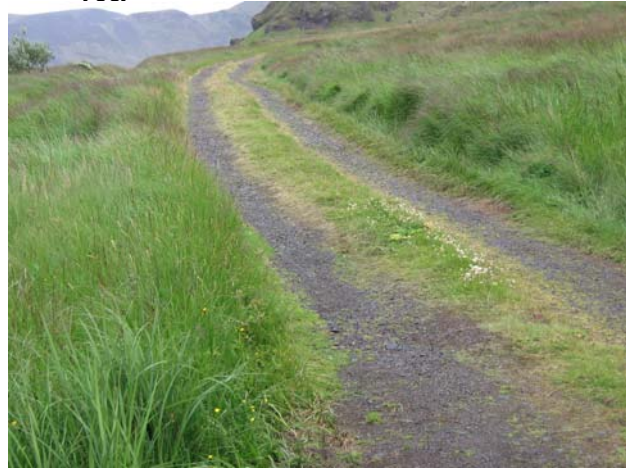
Séð upp neðsta hluta vegarins í Keldudal.

Búið er að gera stofnskjöl fyrir 2 af 5 löndum sem eru í útleigu. Enginn landnemi er með þinglýstan leigusamning.