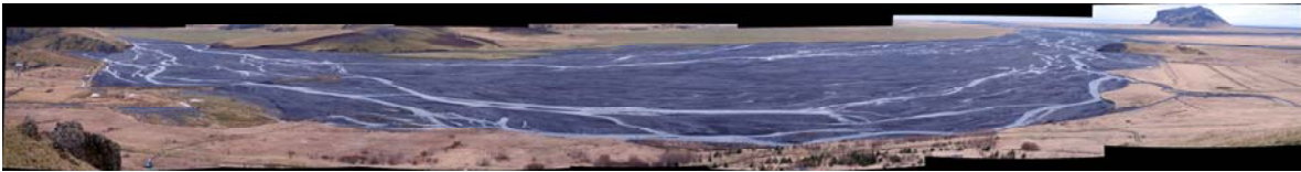
Austursvæðið. Hér má sjá hvernig Hafursá rennur meðfram gróðurlöndinu til suðurs.

Í upphafi var ákveðið að girða einungis af ræktunarsvæðið í landi Keldudals. Girt er milli Álftagrófar og Keldudals, þannig að girðing liggur frá Keldudalsá upp Keldudalsheiðina og austur í Lambárgil. Þaðan eftir Lambárgili niður á aurinn og svo vestur eftir aurnum. Girðingar sem settar hafa verið á aurnum eru nú að mestu ónýtar vegna ágangs Hafursár og Lambár. Undanfarin ár hefur verið unnið við endurbætur á girðingum sem liggja austur eftir aurnum og upp á Keldudalsheiði. Í flóðum s.l. haust hafa þær skemmt og þurfa mikla viðgerð fyrir komandi sumar. Inn eftir Lambárgili hefur girðingin haldið fé frá en eftir að komið er upp á Keldudalsheiðina tekst fénu að koma sér yfir eða undir girðinguna. Megin ástæðan fyrir því er að þegar líða fer á sumar og gras farið að vaxa upp að girðingum, fer rafmagn að leiða út af þeim og skila þær litlum árangri.