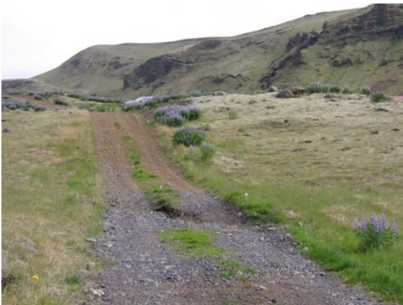
Séð upp neðsta hluta Gilbrautarinnar.

Erfitt er að aka af vesturslóða upp í sjálfa Gilbrautina, sem er sundurgrafin að hluta vegna vatnsflaums í stórrigningum. Á það einkum við um neðri hluta brautarinnar sem er brött. Gilbrautin er vel jeppafær, en tæplega fær venjulegum fólksbílum. Þyrfti að setja ræsi í slakka í brautinni miðri, hefla og bera ofan í veginn. Til þess að hindra að vatn renni eftir veginum þegar rignir þyrfti að grafa grunnan skurð meðfram honum til að veita vatninu burt.