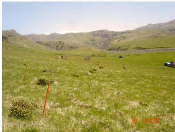
Enginn vegur er um lönd 5-15.