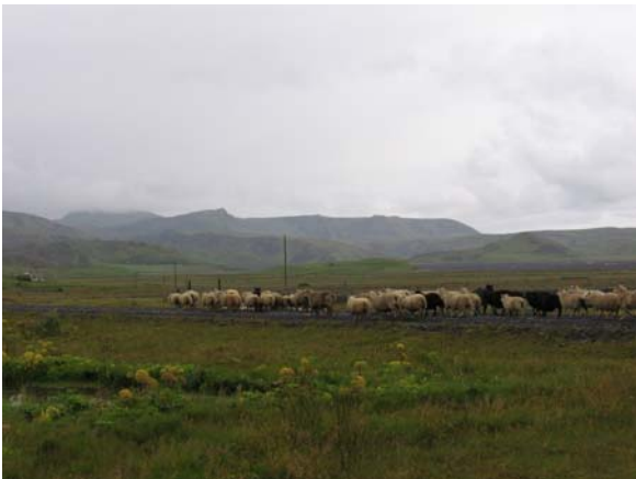
Sauðfé, vinum skógræktarmannsins, smalað saman og það rekið úr Fellsmörkinni, sem á að vera afgirt skógræktarsvæði.

Vestursvæði Fellsmerkur er girt af á náttúrulegan hátt á þrjár hliðar. Að austanverðu er girðing, að hluta rafmagnsgirðing, milli svæðisins og Holts. Í landi Holts gengur búfénaður laus, hestar og kindur. Það er árviss viðburður að kindur séu á löndunum frá seinni hluta sumars og fram á haust þegar smalað er. Kindurnar komast inn á svæðið vegna þess að girðingin er ekki fjárheld þegar líða tekur á sumarið og einnig komast þær undir brúna sem jökulánni Klifanda er veitt undir. Girðingin hefur ekki verið kláruð til norðurs, því ekkert rafmagn er á u.þ.b. 400 metra kafla. Rafmagnsgirðingin er óvirk seinni hluta sumars þar sem gras nær upp í neðstu strengina og skammhleypir það rafmagninu til jarðar. Eigendur bæjarins Fells hafa frá upphafi leyft að girðingin væri tengd rafmagn á bænum en ef rjúfa þarf rafmagnið þarf að komast inn í húsið því enginn rofi er utandyra.