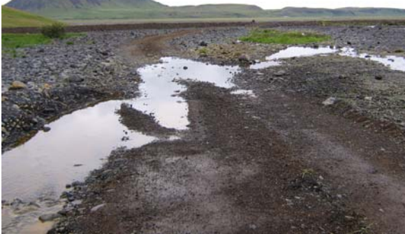
Hér vantar ræsi. Vatn rennur frá heiðinni, vinstra megin á myndinni, yfir veginn og stundum eftir honum. Hefóbundið ástand þegar Klifandi er til friðs.