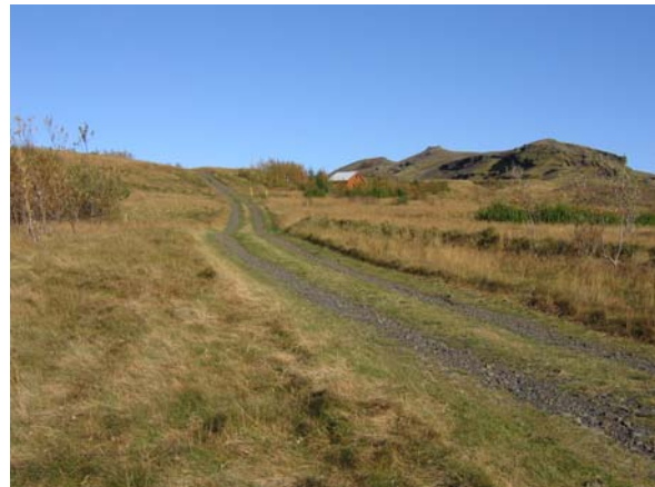
Séð upp Heiðarbrautina.

Brautin inn með Klifanda er í slæmu ástandi og jafnframt étur áin sig sífellt nær veginum þar sem Heiðarbrautin byrjar og er ekki ólíklegt að hún haldi því áfram, sem myndi gera algerlega ófært upp Heiðarbrautina. Upp Heiðarbrautina er slóði, stundum bara grasslóði, sem gott væri að bera reglulega í, sérstaklega þar sem hann getur reynst heldur sleipur og hættulegur fólksbílum í miklum rigningum á sumrin.