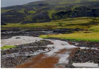
Vegarslóðinn að Heiðarbrautinni.