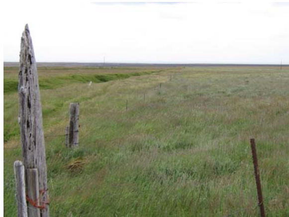
Hér sést hvernig tveir strengir í rafmagnsgirðingunni standa upp úr grasinu en þrír strengir eru á kafi í grasi.

Vegarlóðinn "vesturslóði" sem tengir vestursvæðið við Álftagrófaveg er jeppafær þegar lítið er í ánni. Eftir mikla vatnavexti í haust brast varnargarður við Heiðarbraut og rennur áin eftir vegarstæðinu. Vegurinn liggur samsíða Klifanda og hefur áin hlaðið svo mikið undir sig að hún hleypur sífellt til norðurs og skolar veginum burt. Lækka þarf svæðið sem ánni er ætlað að renna um og hækka svæðið þar sem vegurinn á að vera. En það er ekki bara áin sem eyðileggur veginn heldur rennur vatn frá heiðinni yfir veginn á nokkrum stöðum. Þessu vatni þarf að veita undir veginn og út í Klifanda. Aðeins eitt ræsi er undir þennan tæplega kílómetra langa veg og það er við bæjarlækinn við gamla Fell á móts við Hólsbraut. Setja þarf ræsi áður en komið er að Hólsbraut, milli Hólsbrautar og Gilbrautar og milli Gilbrautar og Heiðarbrautar.