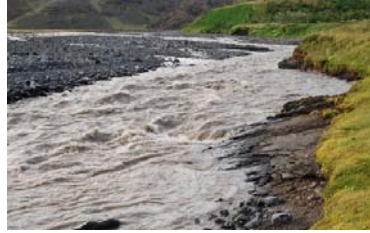
Klifandi étur úr bakkanum við Heiðarbraut.