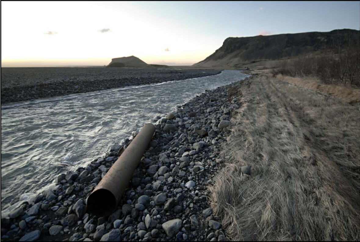
Séð til vesturs. Vegarstæðið orðið að árfarvegi, hvorki fært bílum né bátum.